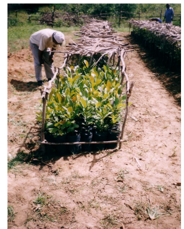
Zanaka mahabibo eo an-tanin-janakazo

Ny masom-boly nampitsiriana mialoha, mitondra raviny vao mitsiry anankiroa aorian'ny folo na dimy ambin'ny folo andro aorian'ny famafazana, dia haketsa anaty kitapo kely plastika mainty (tsara kokoa) manana habe 15 x 25 sm, volavadavaka eo amin'ny ampahatelony ambany ary nofenoina tany masaka sy fasi-drano (1-1) voasivana. Asiana aro hainandro eo ambony.