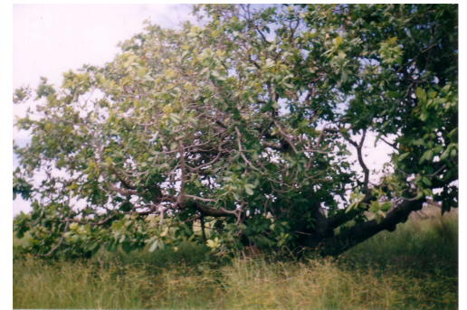
Fototra Mahabibo efa antitra, karazana Mahabibo Zeny avy atsy Brésil . hita ao amin'ny Tobim-pikarohana FOFIFA Mangatsa - Mahajanga -