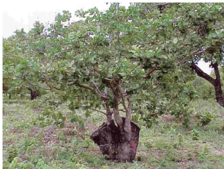
Girefy natao tamin'ny solofon-kazo na « Surgreffage »

Eny an-tanin-janakazo no fanaovana ny girefy. Azo atao koa eny amin'ny solofon-kazo izany : « surgreffage » no ilazana azy ary ny tombony dia ireo solofon-kazo avy amina fototra mamaka tsara izay fantatra fa efa matanjaka tsara. Mitovy ihany ny fomba fanaovana girefy ho an'ity farany ity. Ampiasaina ity fomba ity raha te hanatsara ny vokatra avy amin'ireo fototra miha antitra ka tsy mamokatra firy intsony na ireo fototra manome solofon taorian'ny fandalovan'ny afo.