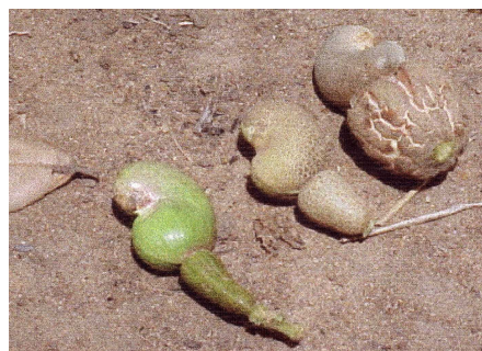
Paoma mahabibo sy voany tratry ny « Oidium »

▪ « Oidium » na « Mildiou » miseho amin'ny fotoam-pamoazana : ohatra misy voaly mamotsifotsy izay eny amin'ny ravina, ny tsiry, ny vondrom-boninkazo ary mahatonga ny fihintanan'ny voninkazo ka miteraka fihenam-bokatra betsaka.