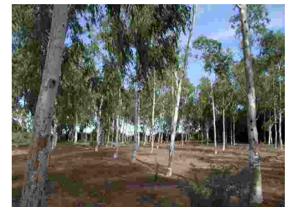
E. camaldulensis (9 taona) Verger à graines FOFIFA ao Toliara I (Betanimena)

Tobim-pikarohana Miadana : 14 m ny ahavo, 38 sm ny savaivo (7 taona sy tapany ary talohan'ny « éclaircie ».