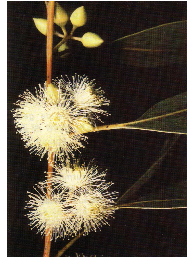
Vonin'ny Eucalyptus camaldulensis

Ilay kalisy hipetrahan'ny voniny no lasa mitombo ka manome ny voakininina miendrika kitso loha, entin'ny taho kely manana savaivo 5 ka hatramin'ny 6 mm, halavana 7 ka hatramin'ny 8 mm.