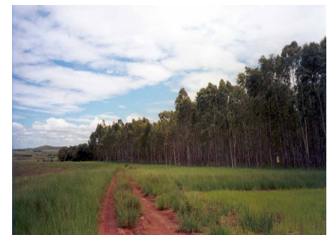
E. camaldulensis (7 taona) Verger à graines FOFIFA- Kianjasoa (Ambatonapoaka)