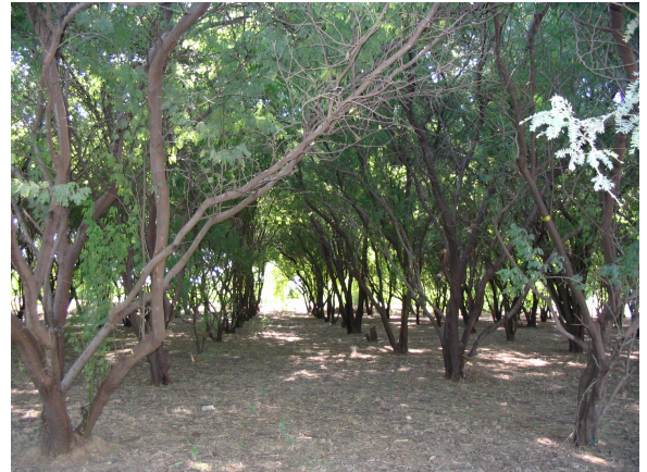
Prosopis juliflora 9 taona - Toliara - FOFIFA/DRFP 2005