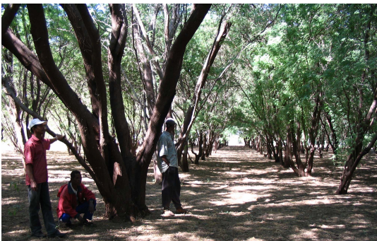
Ny fihaviana Rio Chico no manome vokatra tsara any Toliara (havia ami'ny sary)