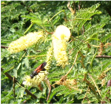
Salohy no endriky ny voniny