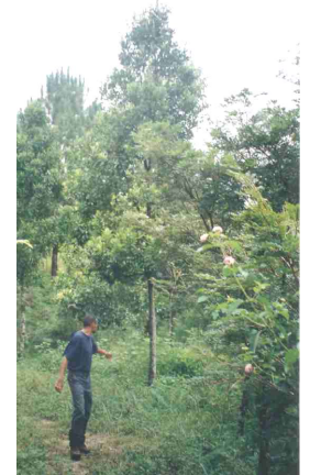
« Varongy fotsy » ( Ocotea racemosa ) 9 taona, nambolena tao Ranomafana-Ifanadiana