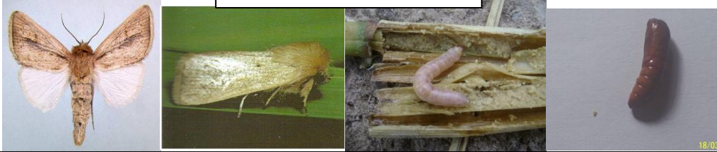
Sesamia calamistis: FOSITRA MAVOKELY (Borer rose) – Mamefy ny katsaka, ny vary an-tanety, fary