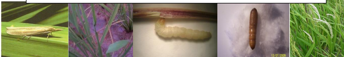
Maliarpha separatella :FOSITRA FOTSY (Borer blanc) – Mamefy ny vary an-DRANO: lolo, atody mihorona amin'ny ravim-bary, soherina sy salohy maty fotsy vokatry ny fanimbana ataon'ny fositra fotsy