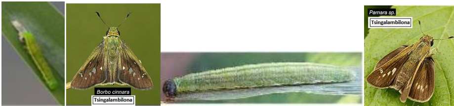
Tsingalabilona : (Borbo) : Olitrasv Lolo