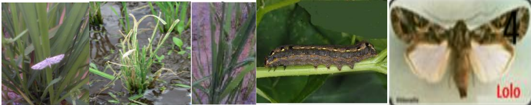
Nymphula :Lolo kely fotsifotsy sy ny Fanimbana ateraky ny fonovilona ary ny olitra