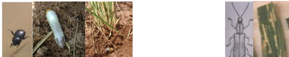
1. Fanimbana ataon'ny VOANA (raha vao mitsiry ny vary) na SAKIVY NA VOANGORY FOTSY VODY/ tapahan'ny foto-bary efa mikibo 2. Nyhaom-bary