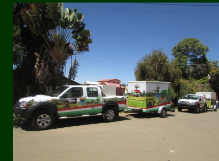
2 picks up