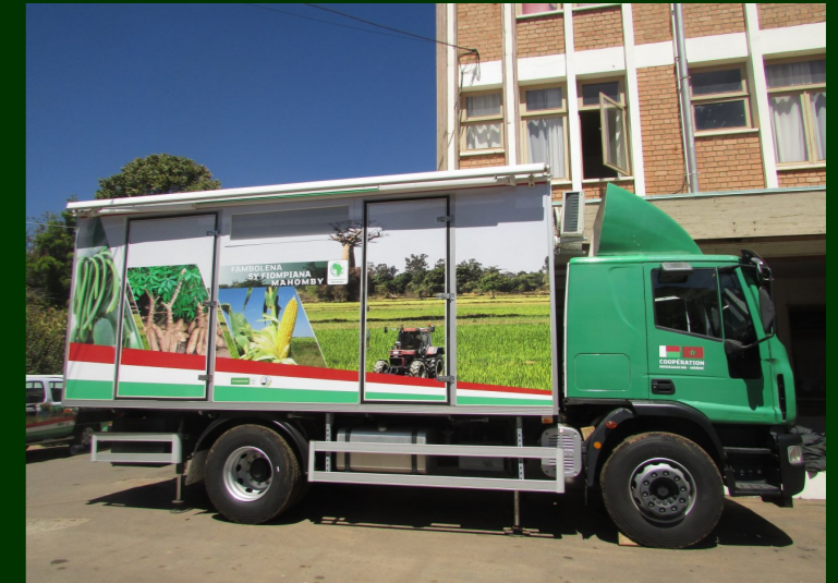
Unité mobile aménagée en Laboratoire d'analyses de sols

9 districts d'ici fin 2017 couvrant les régions agricoles du Vakinankaratra et d'Alaotra et traitant environ 6 cultures prioritaires : Alaotra Mangoro : riz Vakinankaratra : riz, maïs, haricot, pomme de terre