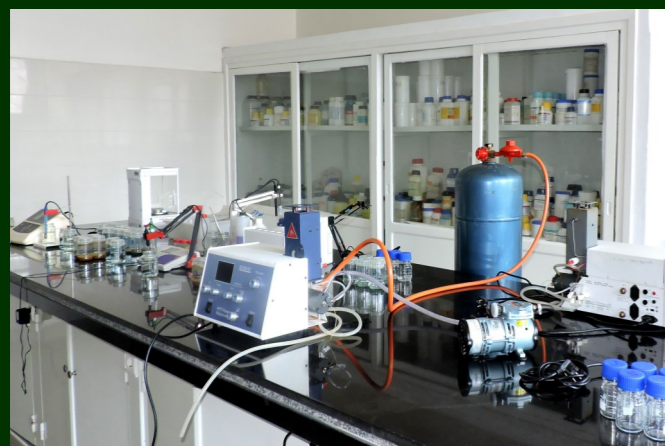
Mise à niveau du Laboratoire d'analyses des sols du FOFIFA Tsimbazaza