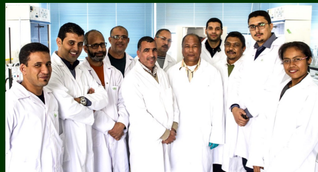
Renforcement des capacités des cadres