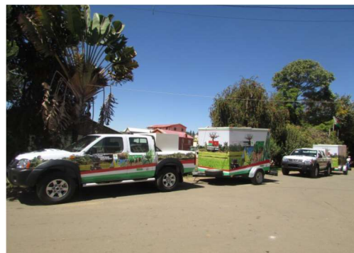
2 pick ups

9 districts d'ici fin 2017 couvrant les régions agricoles du Vakinankaratra et d'Alaotra et traitant environ 6 cultures prioritaires : Alaotra Mangoro : riz Vakinankaratra : riz, maïs, haricot, pomme de terre